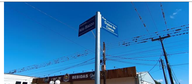
Sinalização vertical Avenida Nilo Bazzo