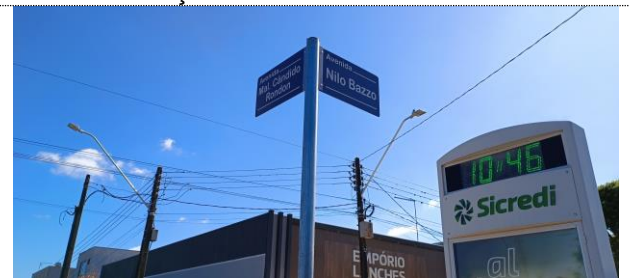
Sinalização vertical Avenida Nilo Bazzo