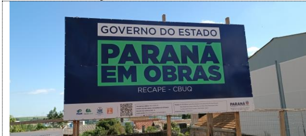
Placa de obra