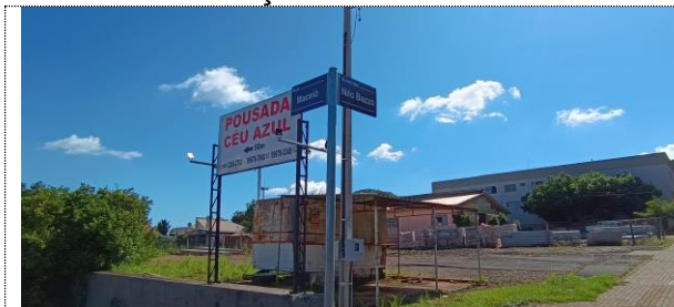
Sinalização vertical Avenida Nilo Bazzo